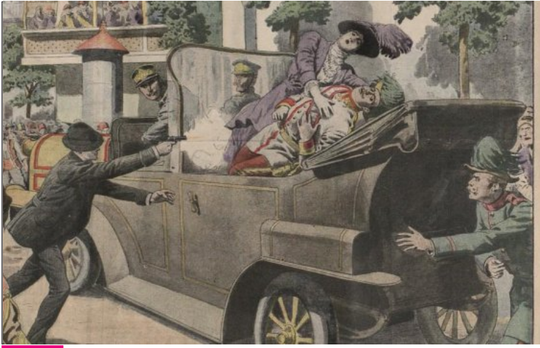
Doc. 4 Le 28 juin 1914, un Serbe assassine l'héritier de l'Empire d'Autriche-Hongrie et sa femme : c'est le déclenchement de la Première Guerre mondiale. Dessin, Le Petit Journal , 12 juillet 1932.